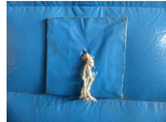
Richtige Durchführung der Seile