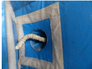
Die Rückwand wird mit Klettverschluss befestigt